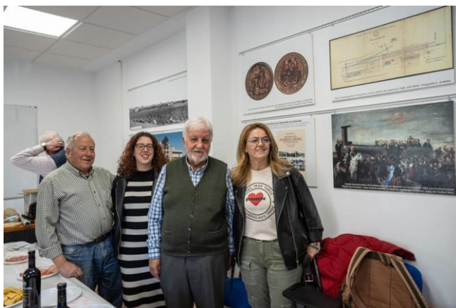
Imágenes expuestas en la muestra sobre el ferrocarril en Ciudad Real