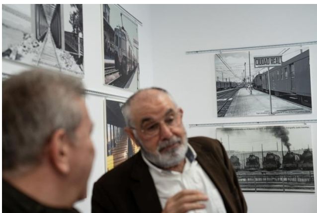
Imágenes expuestas en la muestra sobre el ferrocarril en Ciudad Real / Elena Rosa

La exposición estará visitable en horario de apertura de la Casa de la Ciudad