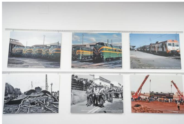
Imágenes expuestas en la muestra sobre el ferrocarril en Ciudad Real

Sobre la exposición, ha dicho, “estará visitable en horario de apertura de la Casa de la Ciudad, de 9:00 a 14:00 horas y de 17:00 a 20:00 horas”.